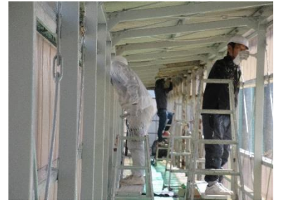
(体育館通路塗装の様子)